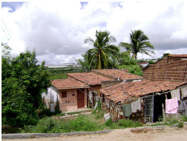
Imagem 01: “Vila dos Teimosos”: sobrevivência às margens do açude de Bodocongó

políticas públicas de esporte recreativo e lazer para os moradores da “Vila dos Teimosos”.